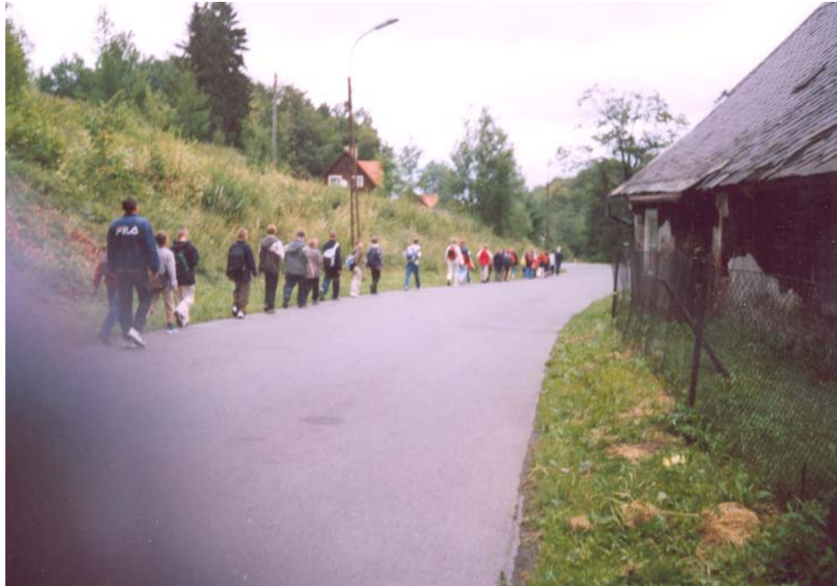
Rys. 3. Prowadzenie grupy kolonijnej drogą bez pobocza.

Drugi kierunek to perspektywiczny program działań wychowawczych szkoły i nauczycieli w zakresie kształtowania postaw i zachowań w ruchu drogowym, uwzględniony w szkolnym programie wychowawczym, realizowany na różnych formach zajęć: lekcyjnych, pozalekcyjnych i pozaszkolnych. Podstawą do tego są zapisy w Konwencji o Prawach Dziecka, Ustawie o systemie oświaty i Rozporządzeniach MENiS w sprawach: bezpieczeństwa i higieny, krajoznawstwa i turystyki oraz ramowych statutów szkół. Dlatego edukacją motoryzacyjną powinni zająć się wszyscy pedagodzy na czele z dyrektorem szkoły jako głównym odpowiedzialnym z tytułu prawa za bezpieczeństwo życia i zdrowia powierzonych dzieci.