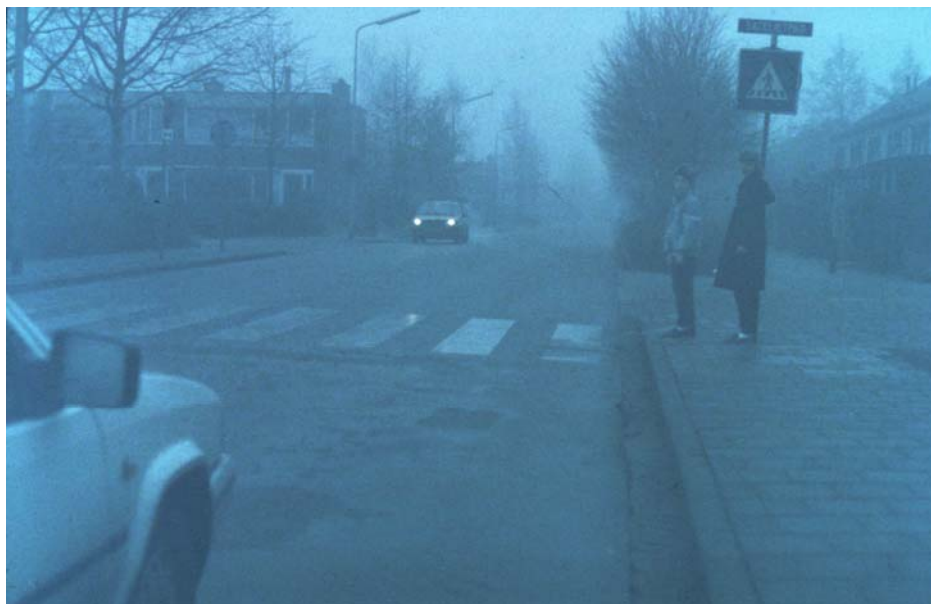
Rys. 5. Słabo widoczne dzieci w czasie mgły (brak elementów odbłaskowych).