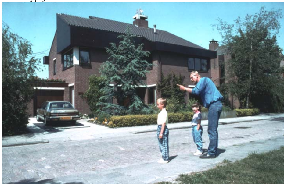
Rys. 4. Rodzicielska lekcja przechodzenia przez ulicę.

Istotnym mankamentem szkolnej edukacji motoryzacyjnej dla brd dzieci i młodzieży w szkołach województwa, a także kraju, jest brak zorganizowanych form współpracy szkoły z rodzicami. Szkoły, z wyraźną akceptacją i poparciem samorządu terytorialnego, powinny tworzyć środowiskowe programy dydaktyczno - wychowawcze, zapraszając do udziału rodziców jako „szkolnych rzeczników brd”. Potrzebne są takie formy organizacyjne, które mają wyraźnie określone cele, zadania wobec rodziców i wieloletni program lokalnych działań edukacyjnych.