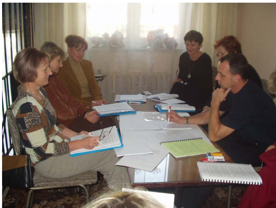
Rys. 1. Szkolenie liderów szkolnej edukacji motoryzacyjnej w Puławach – praca w zespole „Baza dydaktyczna”.